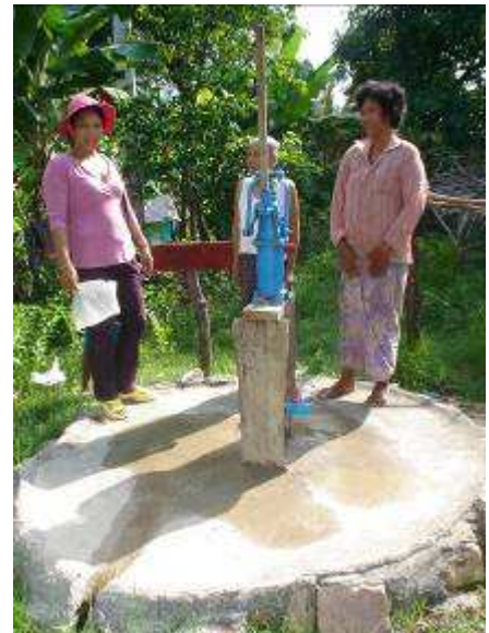
Waterpomp bij de steengroeve